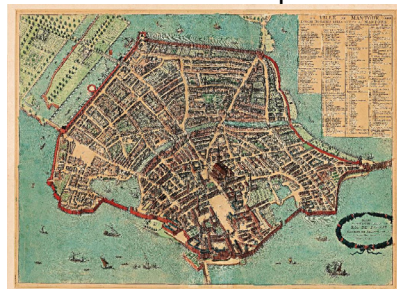
MANTOVA NEL 1700

2.3. h20.30 cena tipica mantovana in locale convenzionato e poi tutti liberi per visitare Manova by-night.